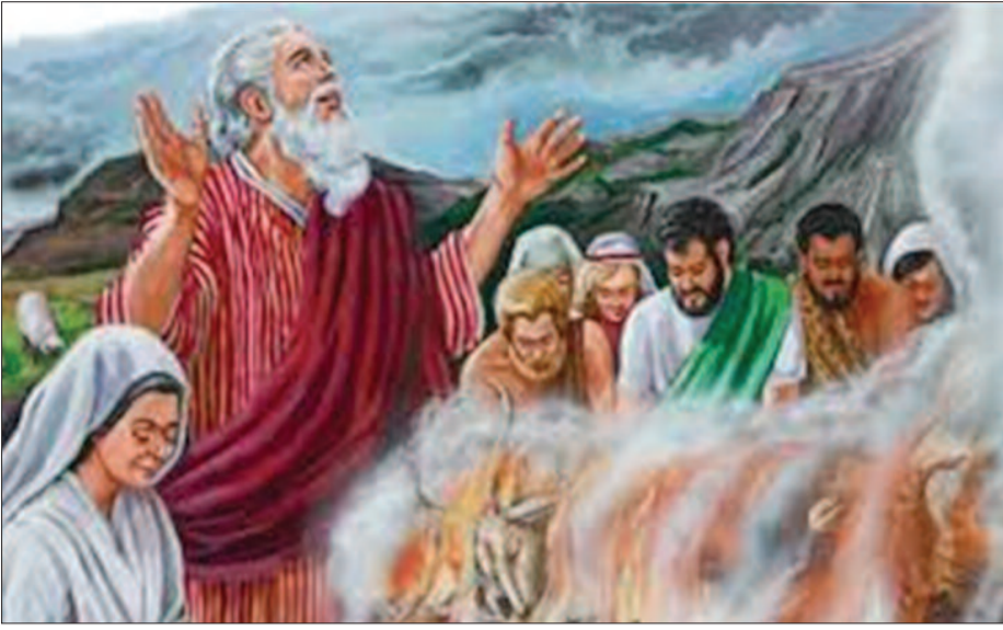
Tufan, Hələzəz dağı, Gəmiqaya, tufandan sonrakı həyat

“...Su çəkildi. İş bitdi. Gəmi Cudi dağı üzərində oturdu...” “...Ey Nuh! Sənə və sənənlə birlikdə (gəmidə) olan camaatdan törənəcək (mömin) ümmətlərə Bizdən əmin-amanlıq və bərəkətlər bəxş edilməklə (gəmidən) en” (“Hud” surəsi, ayə 44, 48). Bəzi ehtimallarla görə, tufan 6 ay çəkir. Nəhayət, Nuhun gəmisi uca bir dağın başında oturur. Tufandan sonra həyat yenidən canlanır. Hər dişi və erkək heyvandan balalar törəyib çoxalır, insanlar da Nuhun üç oğlunun nəslindən artırlar. Buna görə, Adəmdən sonra insanların ikinci ulu əcdadı – ikinci ümummilli babası Nuh Peyğəmbər sayılır.